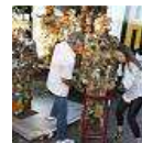
HA Schults Müllmenschchen in Gladbach