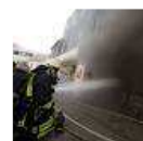
Brand in Bensberg