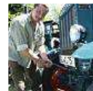
Auf zum Trecker-Treffen!